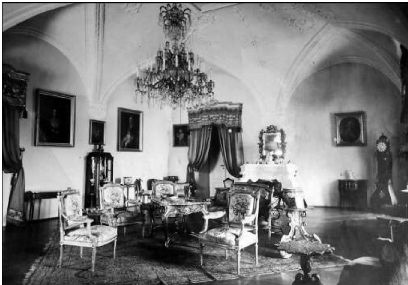
Ukázky původního interiéru