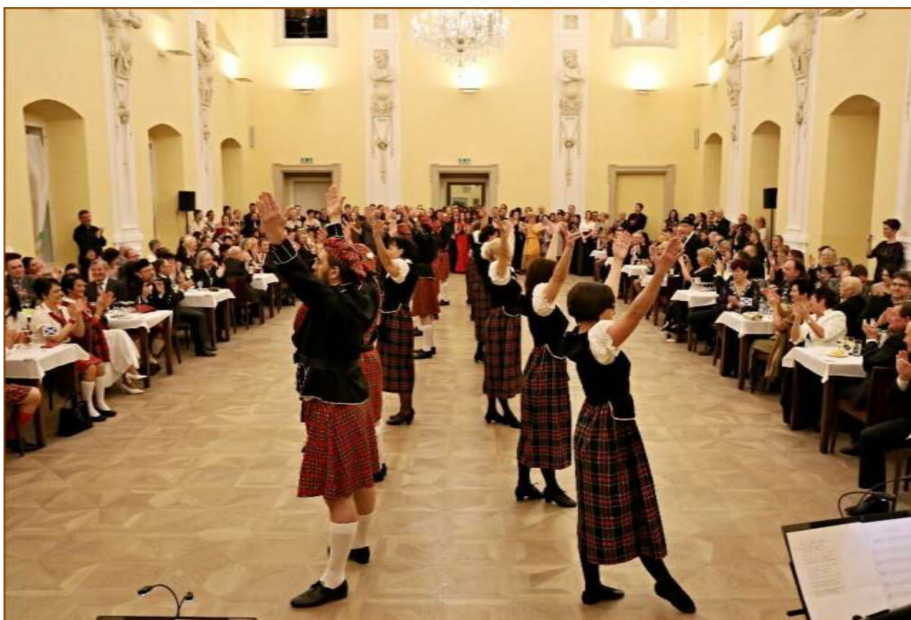
Nálada účinkujících i návštěvníků Keltského plesu byla skvělá